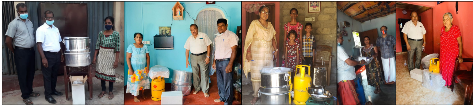
Families receiving String Hopper sets from our AEDU Sri Lanka Coordinators

For each string hopper sold, they will give back Rs 0.50 to the scheme. This money will be used to buy more machines and tools to give other families the opportunity to join the scheme if they wish to. This project was able to take place because of some generous one off donations from our donors in the UK.